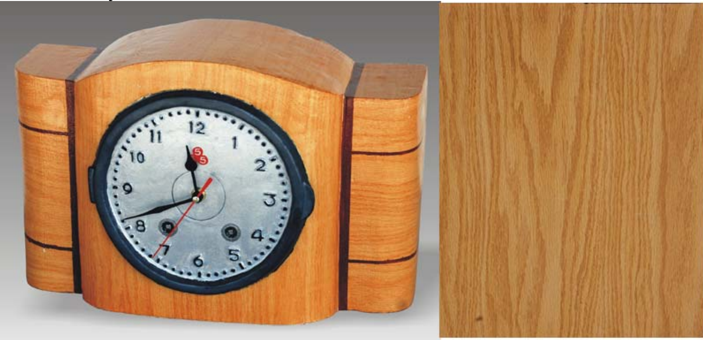
The ceramic artwork was made by Guangzhen Zhou in 2010. This clock is in a fashionable style from Shanghai in 1970's. The wood-patterned overglaze decal was used on the surface. DC 821, original $6.00, on sale $4.00