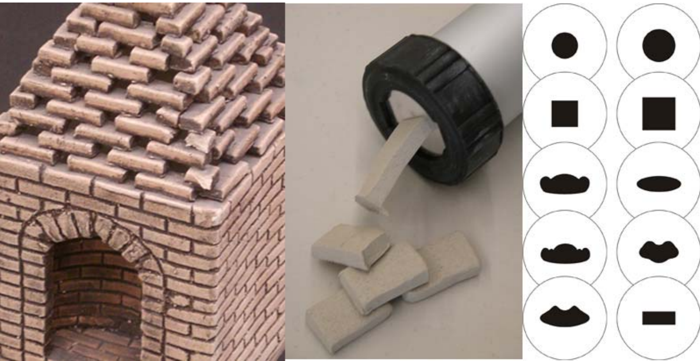
The new set of clay gun dies has just arrived with different designs. One of the dies is rectangular for making miniature bricks in your clay architecture. CG 10, price $18.00.